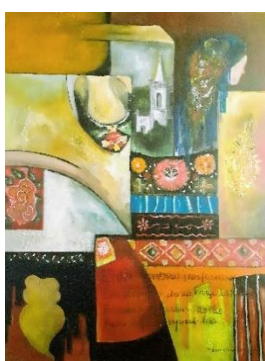
Havemos de ir a Viana, pintura de Mariana Homem de Mello, de 29 de Novembro de 2019 a 31 de Janeiro de 2020.